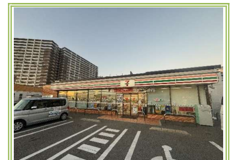
14 セブンイレブン堺鳳南町3丁目店 ... 約450m