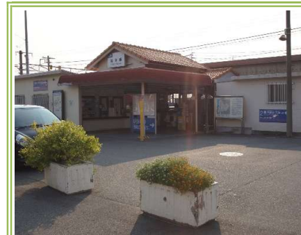
JR阪和線「富木」駅 ... 約450m