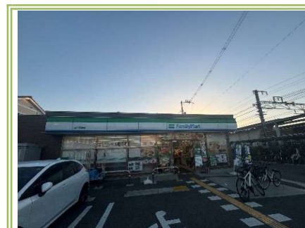
12 ファミリーマート富木駅前店 ... 約450m