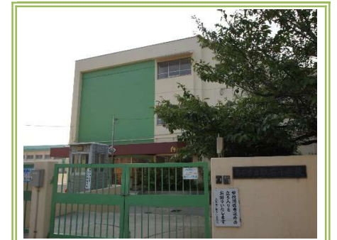
高石市立取石小学校 ... 約950m