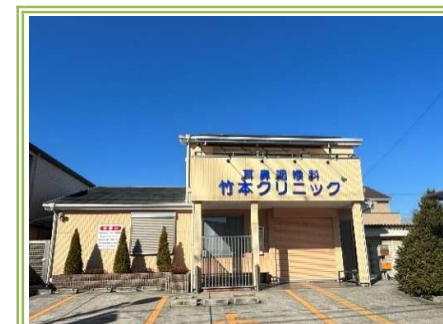
10 竹本クリニック ... 約400m