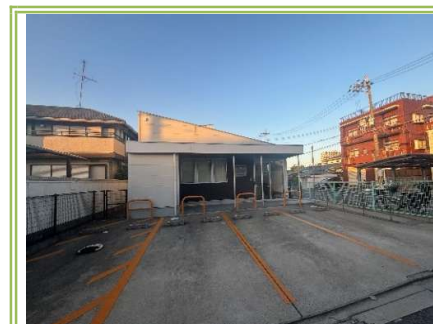
9 宮里小児科 ... 約250m