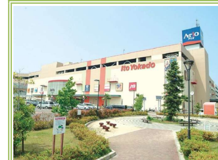
4 アリオ鳳 ... 約500m