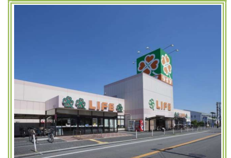
5 ライフ福泉店 ... 約800m