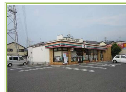
13 セブンイレブン高石取石7丁目店 ... 約600m