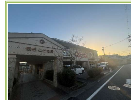
1 取石認定こども園 ... 約800m