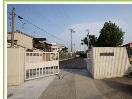
3 高石市立取石中学校 ... 約700m