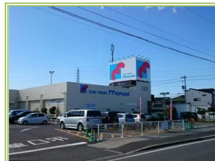
6 万代塚草部店 ... 約800m