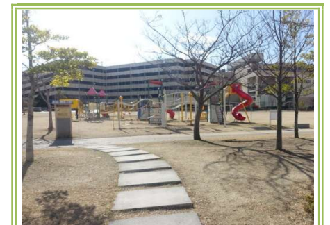
11 鳳公園 ... 約600m