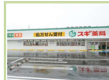
7 スギ薬局取石店 ... 約700m