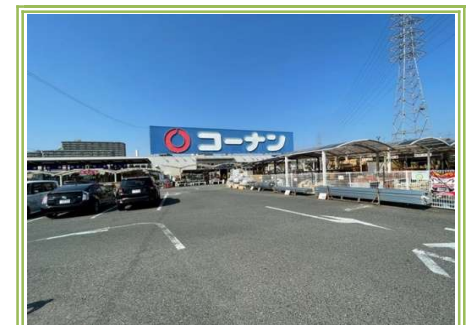
8 コーナン高石富木店 ... 約650m