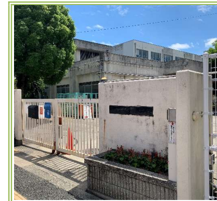
東深井小学校 … 800m