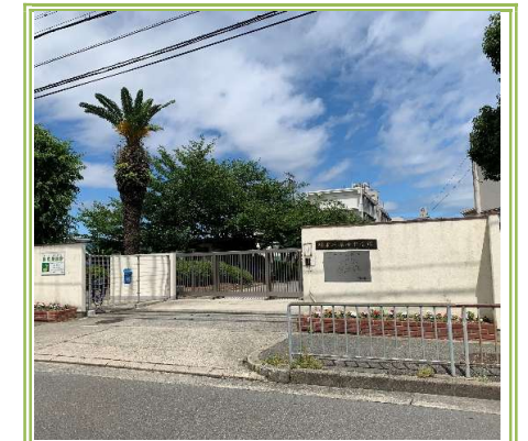
深井中学校 … 1400m