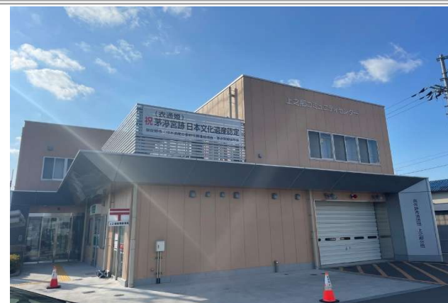
④ 上之郷コミュニティセンター … 約 300m