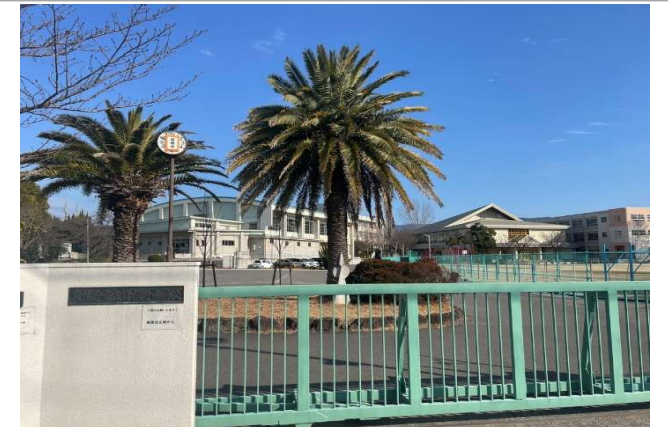
日根野中学校 … 約 1700m