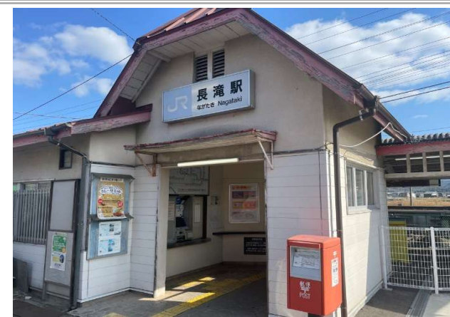
JR阪和線「長滝」駅 … 約 850m