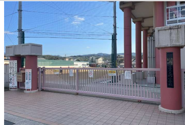
② 上之郷小学校 … 約 400m