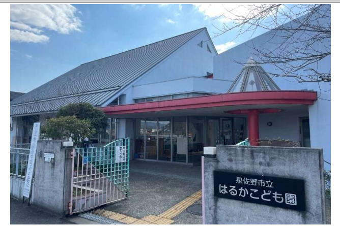
① はるかこども園 … 約 650m