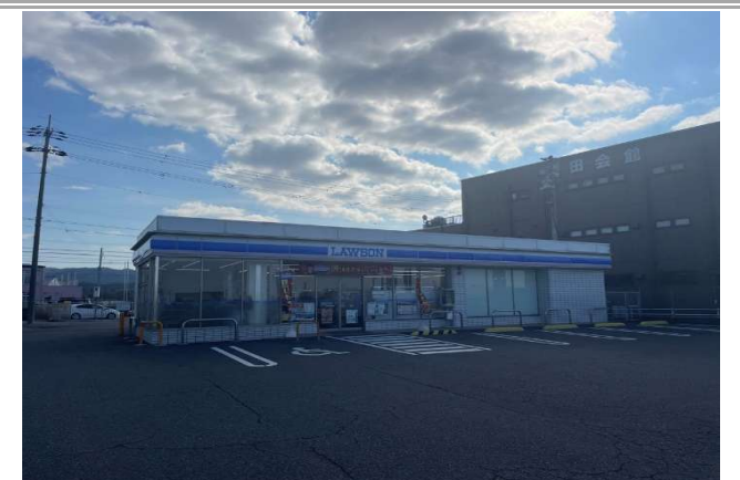
⑧ ローソン泉佐野長滝店 … 約 800m