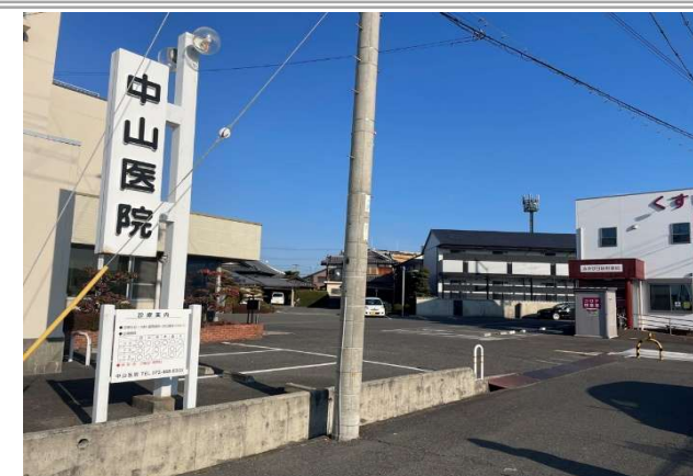
中山医院 … 約 1600m