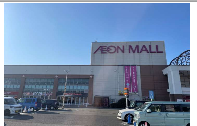
イオン日根野店 … 約 2600m