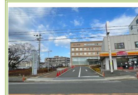
⑬ 野上病院 … 約 1100m