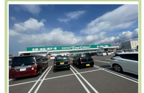
⑤ スーパーエバグリン泉南店 … 約 1000m