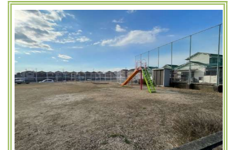
⑪ 砂川大発南側公園 … 約 100m