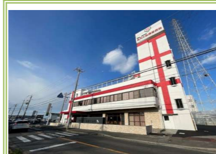
⑫ 泉南大阪晴愛病院 … 約 600m