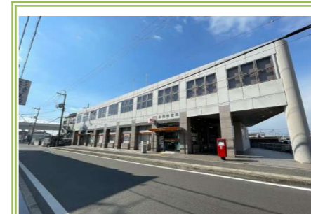
⑩ 泉南郵便局 … 約 1600m