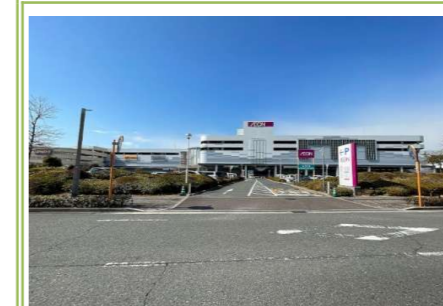
④ イオンりんくう泉南店 … 約 1600m