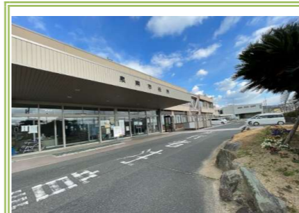
⑨ 泉南市役所 … 約 1000m