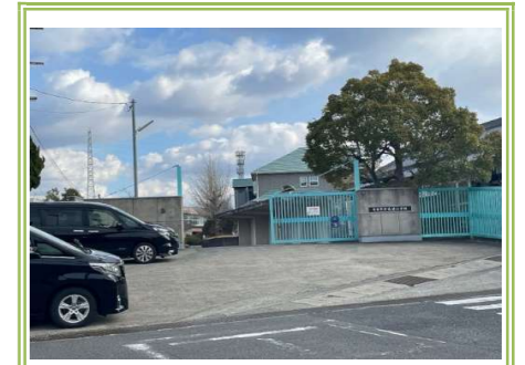
② 鳴滝小学校 … 約 500m