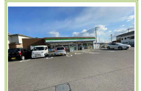
⑭ ファミリーマート泉南信達市場店 … 約 450m