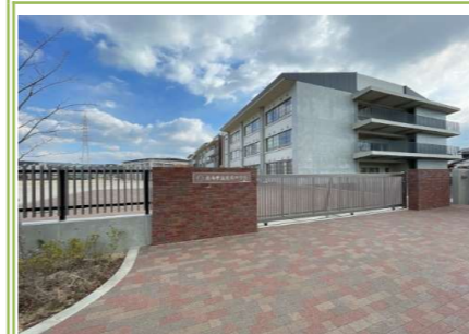
③ 泉南中学校 … 約 1000m