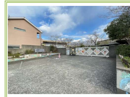
① なるにっこ認定こども園 … 約 450m