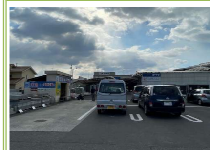
⑥ DCMダイキ泉南店 … 約 1100m