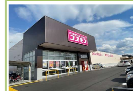
⑦ コスモス泉南樽井店 … 約 1600m