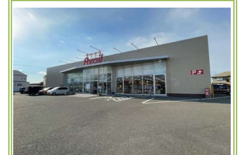
⑧ アベイル泉南店 … 約 1100m