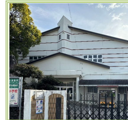
西浦小学校 … 850m