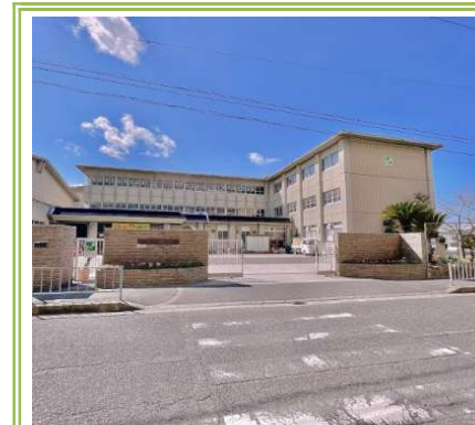
④ 野村中学校 ... 約 230m