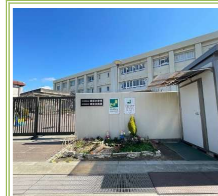
③ 朝陽小学校 ... 約 700m