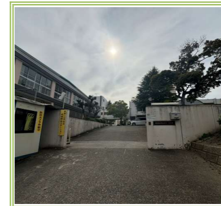
南第一小学校 … 300m