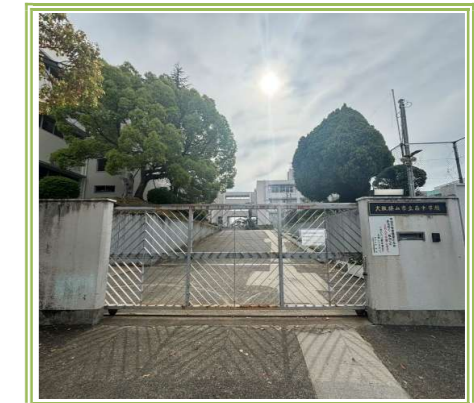
南中学校 … 1300m