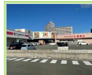
デイリーカナート泉大津店