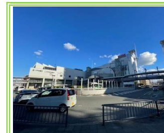
アルザタウン泉大津