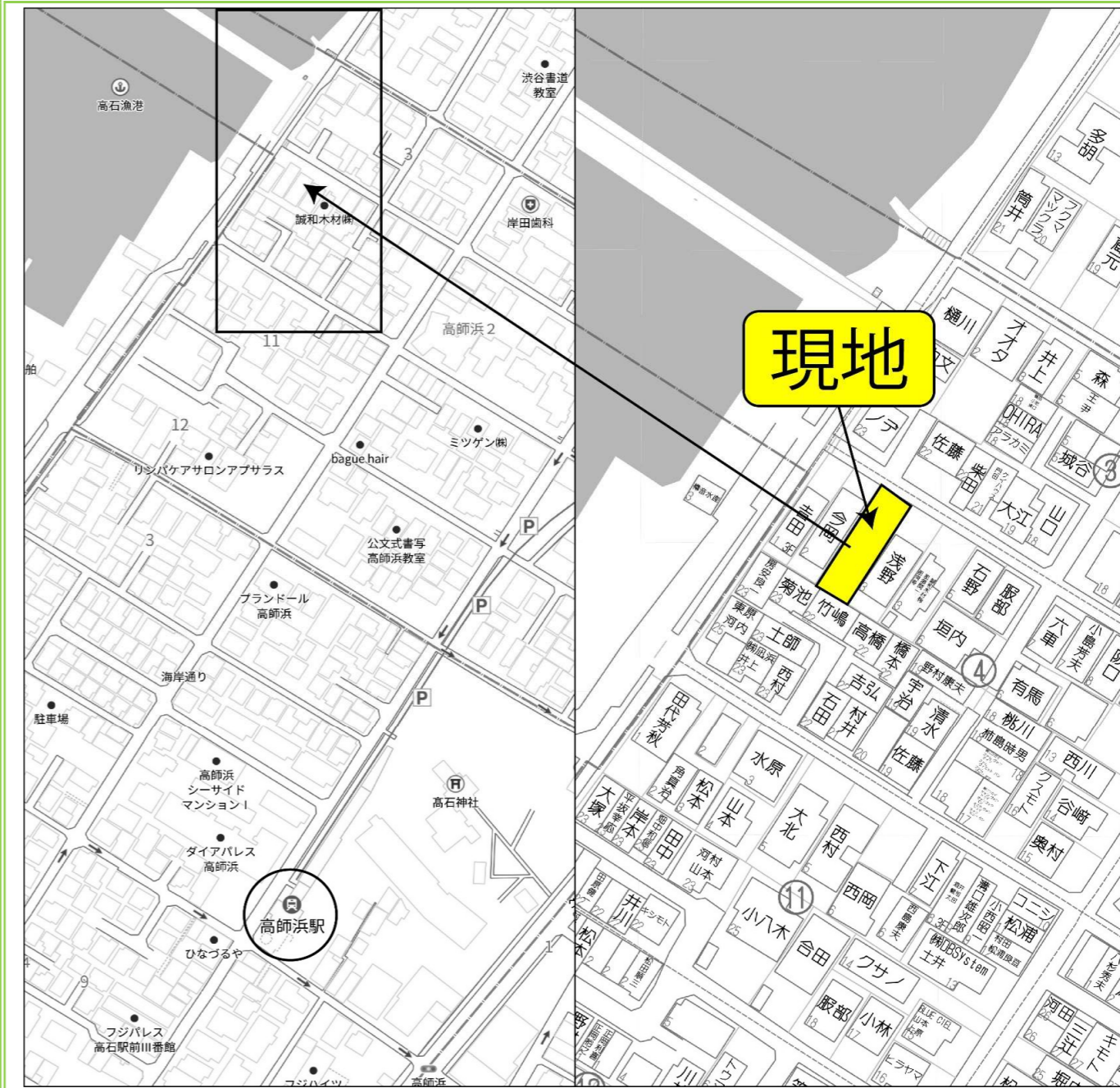
【ナビ検索住所】高石市高師浜2丁目4-2付近